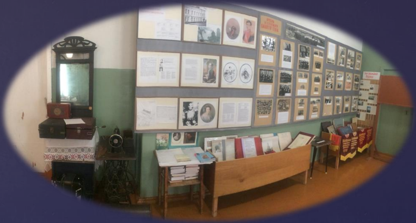
Экспозиция в школе с.Саловка