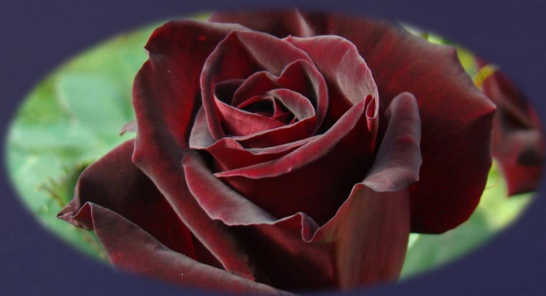
Роза «Александра Бахметева»